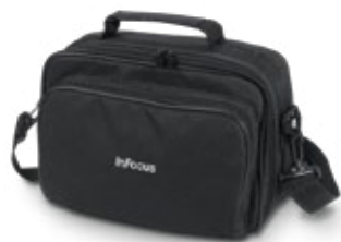
Sacoche rembourrée incluse

Ces projecteurs sont équipés d'un objectif en retrait et d'un capuchon relié pour prévenir choc et perte. De plus, le design monobloc a été conçu pour éviter que de petites pièces qui dépasseraient soient abîmées ou cassées à force de sortir et ranger l'appareil. Enfin, nous sommes si sûrs de la solidité des IN1100 que nous les livrons avec une garantie limitée de 5 ans. De quoi ôter le moindre doute sur leur robustesse et leur capacité à prendre la route.