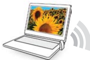
Drahtlose Punkt-zu-Punkt-Konnektivität von bis zu 10 Metern zwischen PC oder Laptop und DisplayLink-fähigem Projektor